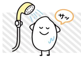
お米はサッと洗う