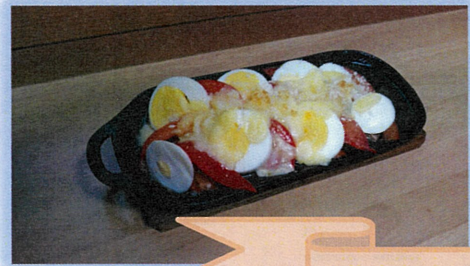
ちょっとスパイス