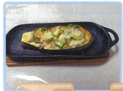
ちょっとスパイス