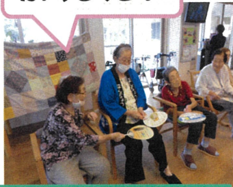
うちわでお手玉送り