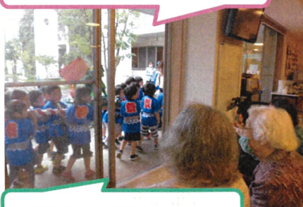
どうもありがとうね♪