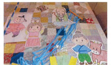
かわいい絵が描けました

7月に入ってすぐ、いつもボランティアでお世話になっている方から立派な笹をわけてもらい、七夕の用意を始めました。折り紙で作った飾りや、願いを込めた短冊を全曜日で書いていただいて、一週間かけて完成！！そして7月7日当日は、職員によるペープサート『七夕の話』の出し物があり、皆で『たなばたさま』の歌を歌ったりと楽しい時間を過ごしました。今年、織姫と彦星は会えたかしら？