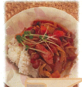
ちょっとスパイス