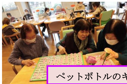
ペットボトルのキャップを使った脳トレ