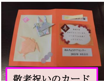
敬老祝いのカード