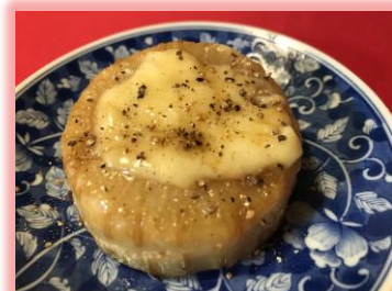
ちょっとスパイス

④チーズをのせて火を消し、蓋をしてチーズが溶けたら お皿に移して、出来上がりです。