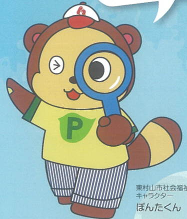
東村山市社会福祉協議会 キャラクター ぼんたくん

東村山市内の福祉施設で働ける求人があります!! フルタイム、パートなど雇用スタイルも様々です。