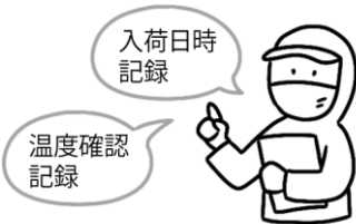
納入業者・食材の品質管理

子どもたちに安全な給食を提供するために、国のガイドラインに沿った衛生管理を行っています。各工程で、決められた内容を実施し、記録しながら作業を行うことで安全性を高めています。