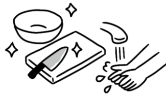
調理室での衛生管理