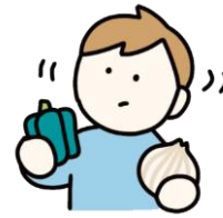
食べ物への興味・関心