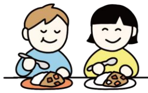
友達と一緒に食事を楽しむ