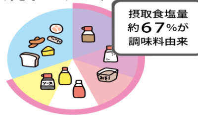
厚生労働省 令和元年 国民健康・栄養調査より作成

日本人が摂取している塩分のうち、調味料由来が67%となっています。減塩するには、「調理に使う調味料」、また「料理にかける食卓調味料」を減らすことが有効です。子どもが好きなマヨネーズ、ドレッシング、ケチャップ、ソースの使い過ぎには注意しましょう。