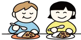
友達と一緒に食事を楽しむ