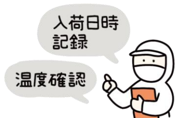
納入業者・食材の品質管理