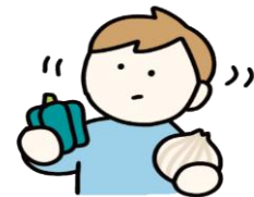
食べ物への興味・関心