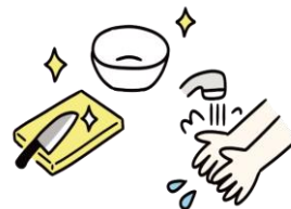
調理室での衛生管理