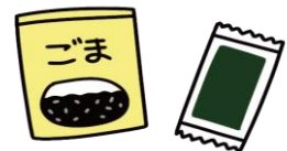
多様な味覚体験を提供