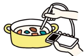
調理時の加熱の徹底(殺菌)