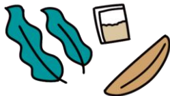
だしを活かした薄味の献立