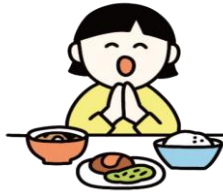
感謝の気持ちを育むマナー

給食の時間は、友達や先生と一緒に食べることで、協調性や社会性を育む大切な場です。「いただきます」「ごちそうさま」を通して、感謝の気持ちや食事のマナーを学びます。楽しい雰囲気の中で、食への興味を引き出し、自分で食べようとする意欲を伸ばします。