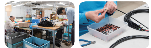
工業用ハーネス加工及びカー用品（包装・箱詰め・袋詰め）パッケージング