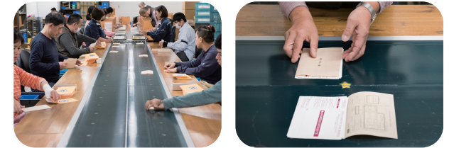
冊子付録の包装及び各種印刷物の帳合・封入・封かん・ラベル貼り作業