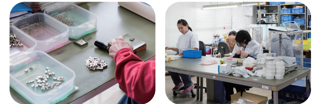
アフターサービス用腕時計部品の包装・梱包、製造用腕時計部品の計数・トレー詰め・送品業務、電子機器部品の加工・組み立て・袋詰め