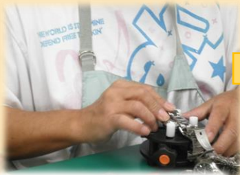
だい とけい ① 台に時計をセット

とけい かいたい さぎょう どけいかぶしきがいしゃ じゅちゅう うでどけい つか 時計の解体の作業では、シチズン時計株式会社から受注している腕時計を使って さぎょう けんかく いただ とき うでどけい ほん じく 作業しています。見学させて頂いた時には、腕時計を1本ずつ治具にセットして、 もじばん うらふた はず 文字盤の裏蓋を外していました。