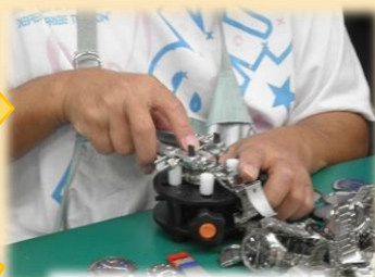
じく かいたい ② 治具で解体