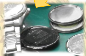
うらふた はず ③ 裏蓋が外れる

おな おお うでどけい さが つづ 同じ大きさの腕時計を探して、続けて かいたい はず さぎょう 解体していくと早く作業できます！！