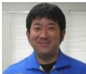
ねもとしよくいん 根本職員

ふくしじぎょう 福祉事業センターは ねんれんぞく へいきんこうちん まんえん こ 2年連続で平均工賃が4万円を超えるという、とても素晴らしい実績を残すことができました。これは みな 皆さんが「働く」という いしき たか も どうしょ 意識を高く持って登所してくれたことがこの結果に繋がっています。 こんねん 今年度も よ 良いことも わる 悪いことも いろいろ 色々ある1年になるとおもいますが、 なに 何かあった時は とき わたし 私たちが みな 皆さんの だす 助けになれるよう しえん 支援しますので、 れいわ 令和5年度も すてきな 素敵な ねん 1年にしていきたいと思います！！