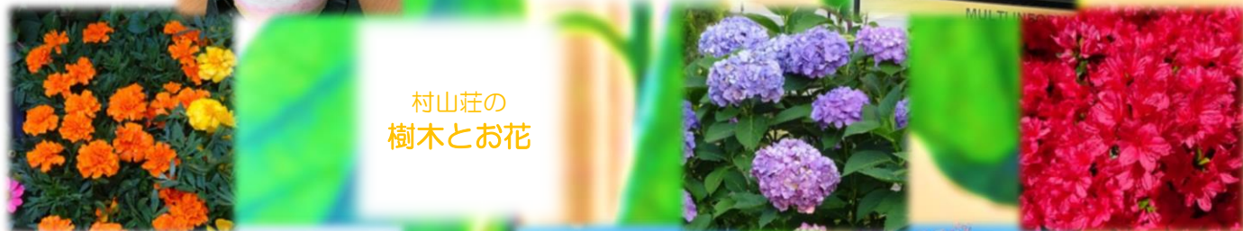
村山荘の 樹木とお花