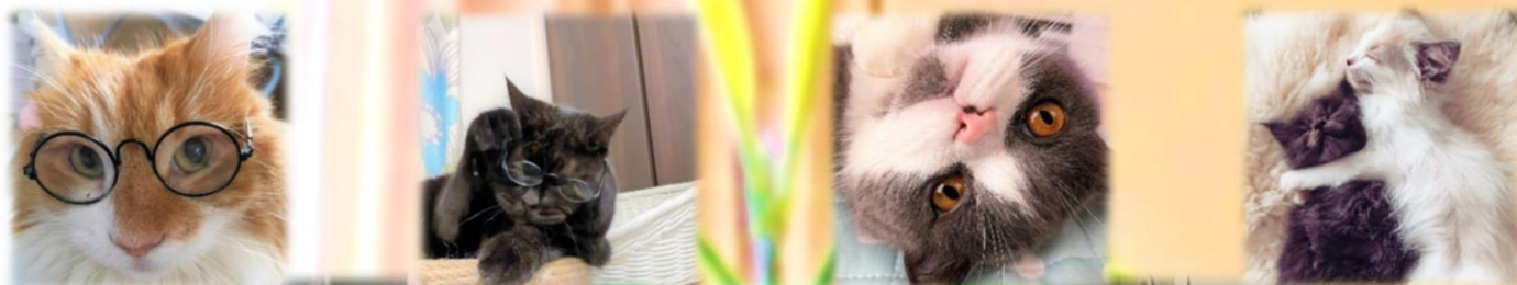
愛猫とツバメ 江川職員 寄稿

『14.海の豊かさを守ろう🌊』と『15.陸の豊かさも守ろう🌳』にちなみ、スマイルでは本年度を動植物愛護年間とし、前号に続き、村山荘とご縁のある動植物の皆様の写真を掲載します！