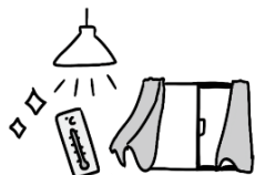
温度・湿度 風通し・明るさ

子どもは気になることがあると、気がそれて食事を進めることができなくなってしまいます。環境を整えて食事に集中させてあげることが大切です。