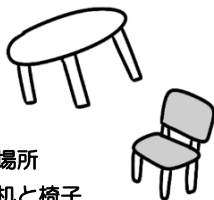
いつもの場所 いつもの机と椅子