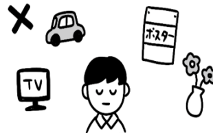
子どもの目に入る場所に貼るもの・置くものに注意