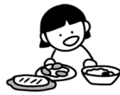
食卓で料理を見る